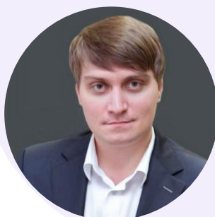
Виктор Неумывакин Директор Департамента Минпросвещения России

В ходе пресс-конференции в пресс-центре ТАСС (26 сентября, Москва)